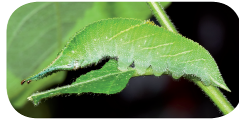
Großer Schillerfalter ( Apatura iris ) auf Salweide