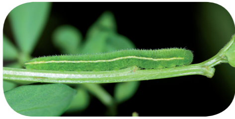
Leguminosen-Weißling ( Leptidea sinapis ) auf Hornklee