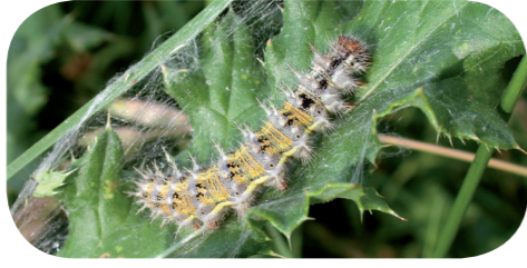
Distelfalter ( Vanessa cardui ) auf Distel