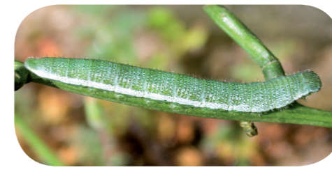
Aurorafalter ( Anthocharis cardamines ) auf Knoblauchsrauke