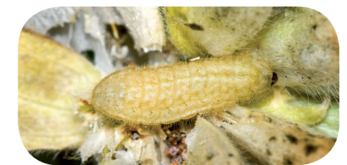
Zwerg-Bläuling ( Cupido minimus ) auf Wundklee