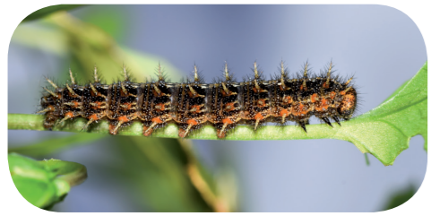
Kleiner Perlmutterfalter ( Issoria lathonia ) auf Ackerstiefmütterchen