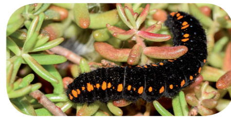
Apollofalter ( Parnassius apollo ) auf Weißer Fetthenne