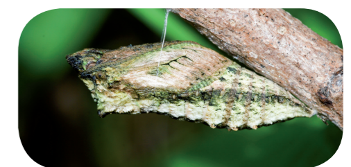
Schwalbenschwanz (Puppe) ( Papilio machaon )

Wissenswertes über Schmetterlinge und Artenporträts auf der BUND-Schmetterlingshomepage: