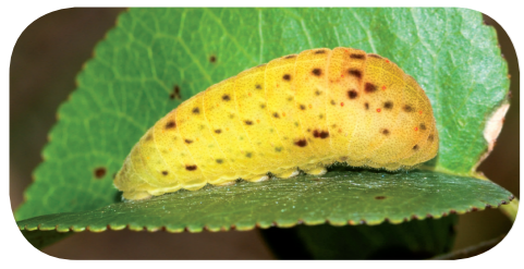
Segelfalter ( Iphiclides podalirius ) auf Felsenkirsche