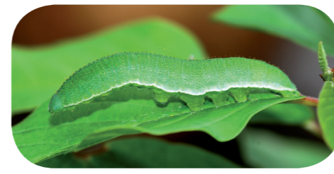
Zitronenfalter ( Gonepteryx rhamni ) auf Faulbaum