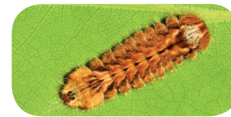
Blauer Eichen-Zipfelfalter ( Favonius quercus ) auf Eiche