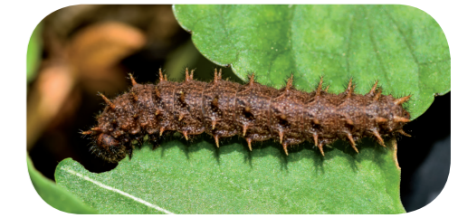
Randring-Perlmutterfalter ( Boloria eunomia ) auf Wiesenknöterich