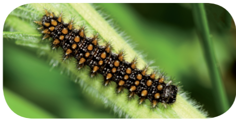
Baldrian-Scheckenfalter ( Melitaea diamina ) auf Baldrian