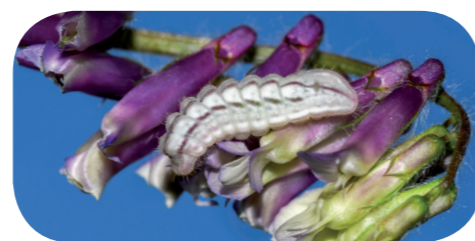
Alexis-Bläuling ( Glaucopsyche alexis ) auf Vogelwicke