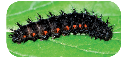
Großer Perlmutterfalter ( Speyeria aglaja ) auf Veilchen