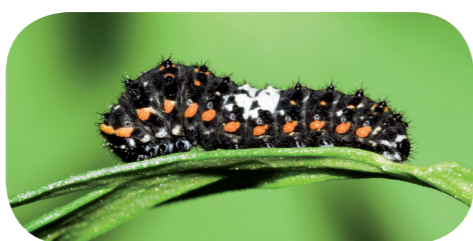
Schwalbenschwanz (L2) ( Papilio machaon ) auf Möhre