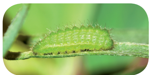
Hauhechel-Bläuling ( Polyommatus icarus ) auf Luzerne