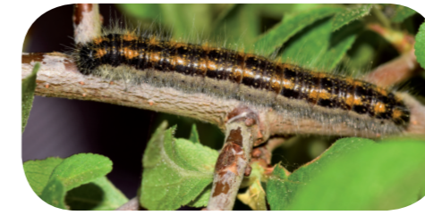
Baumweißling ( Aporia crataegi ) auf Schlehe