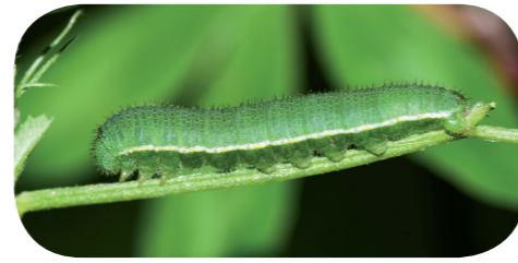
Weißklee-Gelbling ( Colias hyale ) auf Hornklee