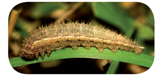
Schornsteinfeger ( Aphantopus hyperantus ) auf Grashalm