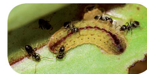
Fetthennen-Bläuling ( Scotolides orion ) auf Großer Fetthenne