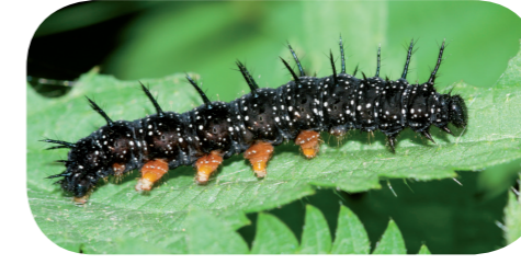
Tagpfauenauge ( Aglais io ) auf Brennnessel