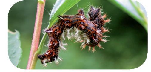
C-Falter ( Polygonia c-album ) auf Stachelbeere