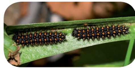
Wachtelweizen-Scheckenfalter ( Melitaea athalia ) auf Spitzwegerich