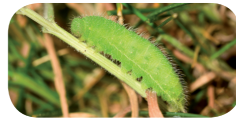
Großes Ochsenauge ( Maniola jurtina ) auf Gras