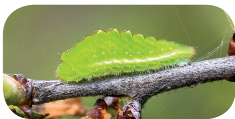
Pflaumen-Zipfelfalter ( Satyrium pruni ) auf Schlehe