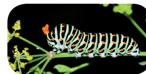
Schwalbenschwanz (L5) ( Papilio machaon ) mit Stirngabel auf Dill