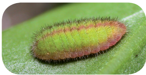
Kleiner Feuerfalter ( Lycæna phlaeas ) auf Sauerampfer