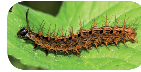
Kaisermantel ( Argynnis paphia ) auf Veilchen