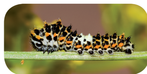
Schwalbenschwanz (L3) ( Papilio machaon ) auf Pastinake