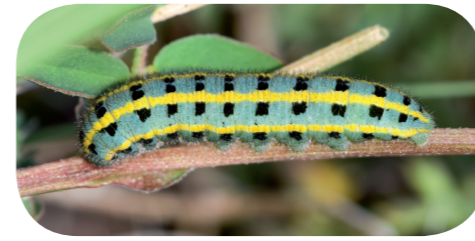
Hufeisenklee-Gelbling ( Colias alfarcariensis ) auf Hufeisenklee