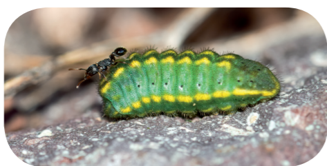
Himmelblauer Bläuling ( Lysandra bellargus ) unter Hufeisenklee