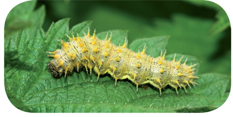
Admiral ( Vanessa atalanta ) auf Brennnessel