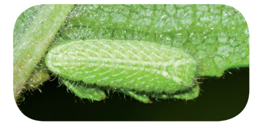
Nierenfleck-Zipfelfalter ( Thecla betulae ) auf Schlehe