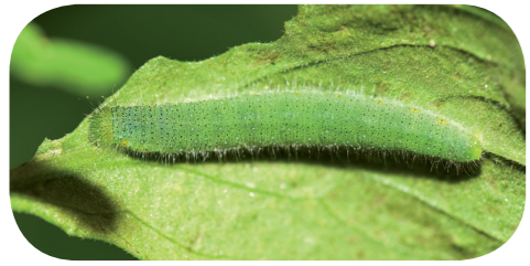
Grünader-Weißling ( Pieris napi ) auf Pfeilkresse