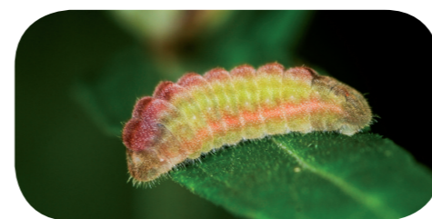
Faulbaum-Bläuling ( Celastrina argiolus ) auf Blutweiderich