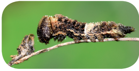
Großer Eisvogel ( Limnitis populi ) auf Zitterpappel