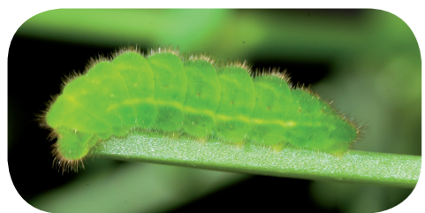
Grüner Zipfelfalter ( Callophrys rubi ) auf Hornklee