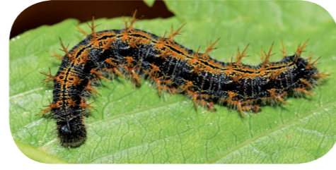
Großer Fuchs ( Nymphalis polychloros ) auf Kirsche