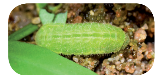
Kronwicken-Bläuling ( Plebeius argyrognomon ) unter Bunter Kronwicke