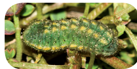
Silbergrüner Bläuling ( Lysandra coridon ) auf Hufeisenklee