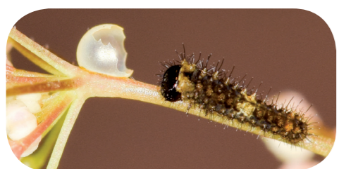
Schwalbenschwanz (L1) ( Papilio machaon ) mit Eihülle