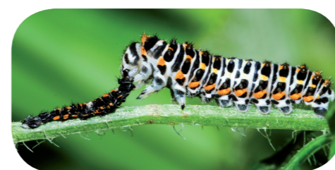
Schwalbenschwanz (L4) ( Papilio machaon ) nach der Häutung