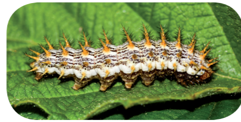
Brombeer-Perlmutterfalter ( Brenthis daphne ) auf Brombeere