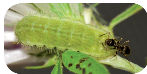
Rotklee-Bläuling ( Cyaniris semiargus ) auf Rotklee