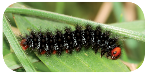
Wegerich-Scheckenfalter ( Melitaea cinxia ) auf Spitzwegerich