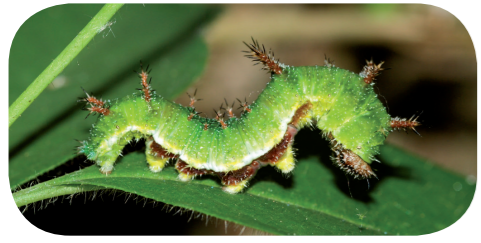
Kleiner Eisvogel ( Limnitis camilla ) auf Deutschem Geißblatt