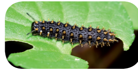
Braunfleckiger Perlmutterfalter ( Boloria selene ) auf Veilchen