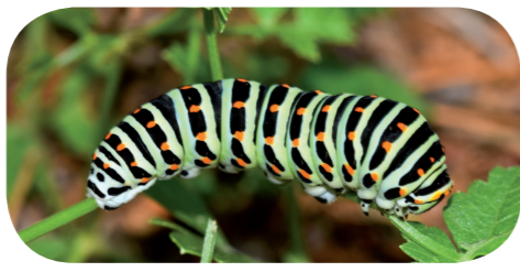
Schwalbenschwanz ( Papilio machaon ) auf Haarstrang