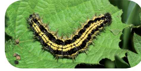
Kleiner Fuchs ( Aglais urticae ) auf Brennnessel