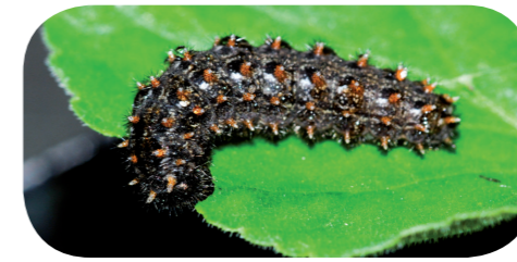
Magerrasen-Perlmutterfalter ( Boloria dia ) auf Veilchen