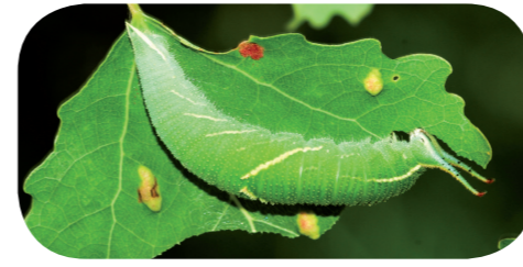
Kleiner Schillerfalter ( Apatura ilia ) auf Zitterpappel