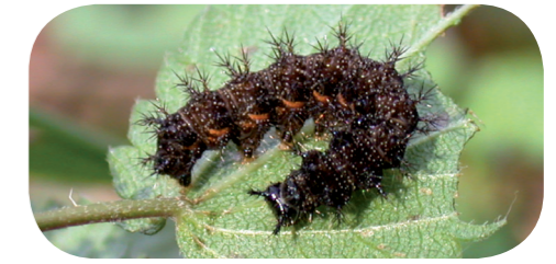
Landkärtchen ( Araschnia levana ) auf Brennnessel