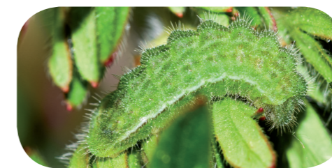
Storchschnabel-Bläuling ( Eumedonia eumedon ) auf Blutstorchschnabel