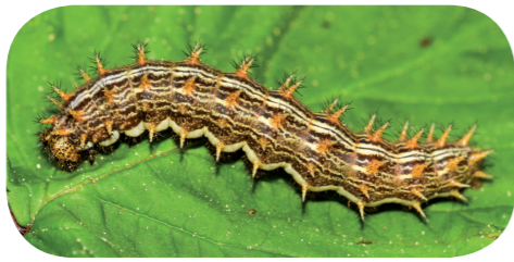
Mädesüß-Perlmutterfalter ( Brenthis ino ) auf Mädesüß