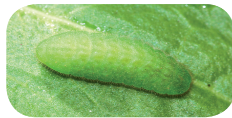
Brauner Feuerfalter ( Lycæna tityrus ) auf Sauerampfer