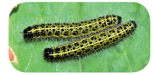
Großer Kohlweißling ( Pieris brassicae ) auf Pfeilkresse