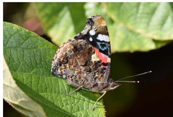
Abbildung 2: Admiral mit zusammengeklappten Flügeln auf einer Kiwi neben einem Schmetterlingsflieder im Garten in Bingen-Dromersheim am 23.8.2016.

Die Flügelunterseite der Hinterflügel ist braun-grau meliert und bietet deshalb auch im Winter eine optimale Tarnung.